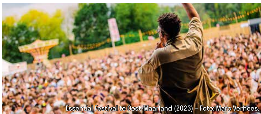
Essential Festival te Oost-Maarland (2023) – Foto: Marc Verhees.

Het evenement is toegankelijk vanaf 16 jaar en ouder. De organisatoren achter Essential Festival zijn E&A Events, 4PM Entertainment en D2D Projects.