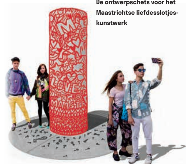
De ontwerpschets voor het Maastrichtse liefdesslotjes-kunstwerk

Maastricht wordt in de toeristische media het 'Parijs van Nederland' genoemd. Maastricht is de meest buitenlandse stad van Nederland. Maastricht, ook vooral in de weekends, is een gezellige, gastronomische, bourgondische, rustige, levendige stad, alwaar jong en oud graag vertoeven. Maastricht heeft een Franse inslag, romantisch, anders. Het liefdesslotjes kunstwerk heeft als doel om mensen te verbinden, met elkaar en met de stad.