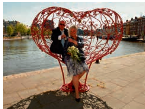
Het kunstwerk Lockers of Love in Rotterdam

is een belevenis op zich. Maastricht is een internationale stad waarin de ontmoeting centraal staat. Los van de eigen inwoners is er een grote studentenpopulatie en bezoeken talrijke congresgangers uit binnen- en buitenland, expats, dagjesmensen en toeristen de stad. Al deze mensen kunnen hun liefde middels een liefdesslotje vastleggen. Er zijn al liefdesslotjes in alle mogelijke vormen te bewonderen nabij de Wycker Waterpoort en op de Wilhelmina-brug. De meeste mensen hebben in de hefboom van de Sint Servaas echter een ideale plek gevonden om hun liefde in Maastricht te 'bezegelen'. Ervaring elders