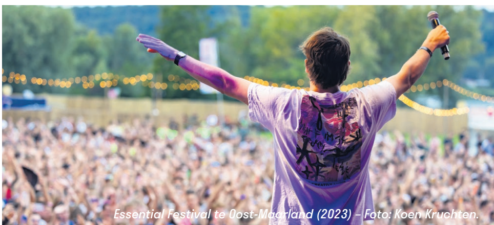
Essential Festival te Oost-Maarland (2023) - Foto: Koen Kruchten.

Het evenement is toegankelijk vanaf 16 jaar en ouder. De organisatoren achter Essential Festival zijn E&A Events, 4PM Entertainment en D2D Projects.