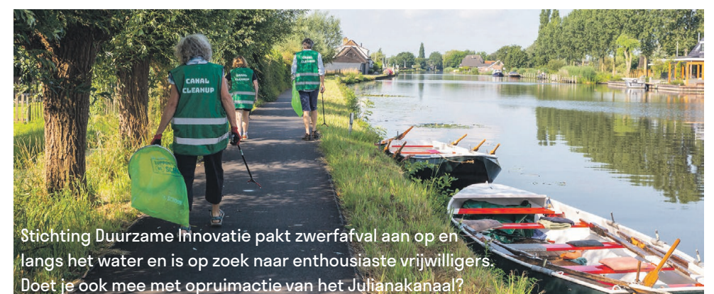
Stichting Duurzame Innovatie pakt zwerfafval aan op en langs het water en is op zoek naar enthousiaste vrijwilligers. Doet je ook mee met opruimactie van het Julianakanaal?

Aanmelden en meer info is te vinden op www.duurzameinnovatie.eu