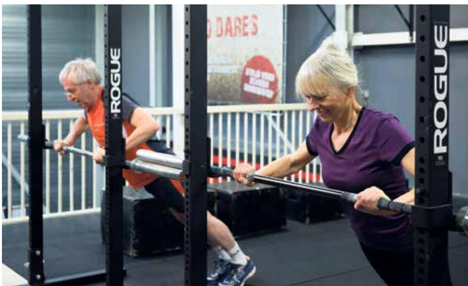
Aat: 'Door de trainingen ben ik sterker geworden en heb ik geen last meer van mijn onderrug!'

Bel Ben-Anne op 030-752 35 48. Heerderdwaarsstraat 26-28, 6224 LT, Maastricht. In de sportschool van CrossFit Batteraaf. Bij het Heugemerveld, achter het spoor, aan het einde van de groene loper, naast Regie Auto's.