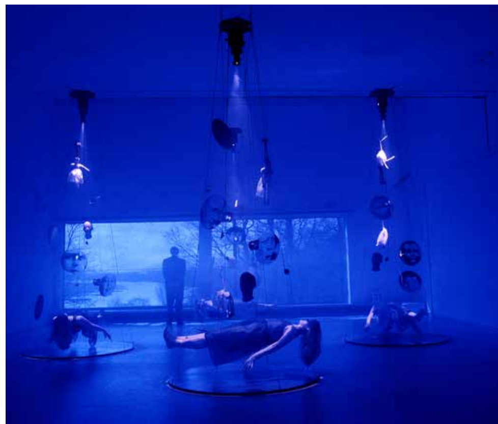
Lydia Schouten, Shattered Ghost Stories, 1993. Collectie Museum Arnhem.