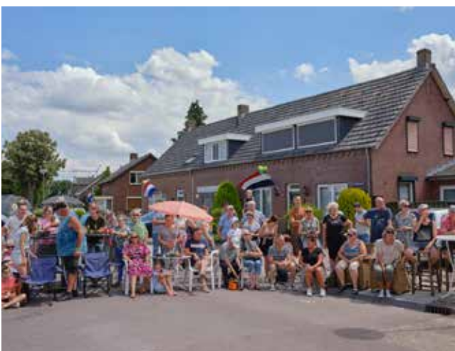
OLS Meijel 2022 De Mix Nederland 'Vieren!'

Een duo tentoonstelling op NS station Maastricht en in Centre Céramique Maastricht