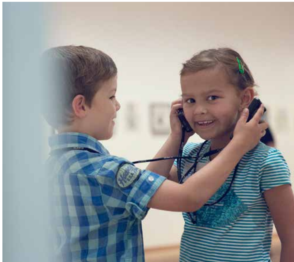
Kids audiotour

Op 15 september is er weer een Bonnefanten Free Friday, dus zet het in de agenda. Van 20.00-23.00 uur staan de deuren van het museum wagenwijd open, voor iedereen. Gratis! Wij maken deze avonden voor, door & met jou. Maak er een gezellige avondje uit tussen de kunst van, vol met activiteiten, workshops en muziek.