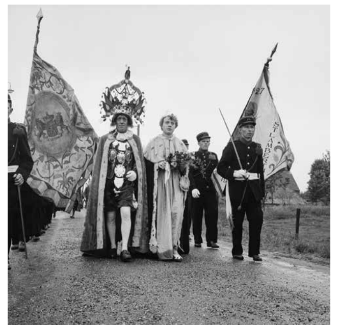
Oud Limburgs Schuttersfeest, Oler-Grathem 1 juli 1956

De Mix Nederland 'Vieren!' is de Zuid-Limburgse en zesde editie in een serie van twaalf tentoonstellingen van de Mix Nederland, een initiatief van stichting Beeldmix samen met Centre Céramique, NS en ProRail. De Mix Nederland wordt ondersteund door het Mondriaan Fonds, Prins Bernhard Cultuurfonds en de provincie Limburg. Bij iedere editie wordt historische fotografie gebruikt als bron van inspiratie door de hedendaagse Nederlandse fotografen.