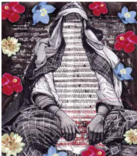
patricia kaersenhout, The politics of the Black female body #13 (bewerkt), 2012.

Bezoekadres museum: Avenue Céramique 250, Maastricht | T: +31 (0)43 329 01 90